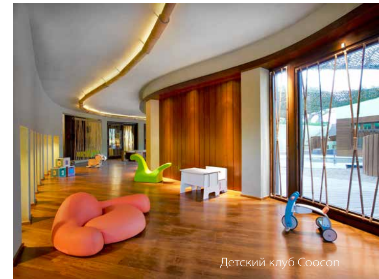
Детский клуб Coccoon

По всем вопросам, а также по бронированию Вашего отдыха обращайтесь в JSP Business Travel Company www.JSPtravel.ru, +7 812 335 10 03