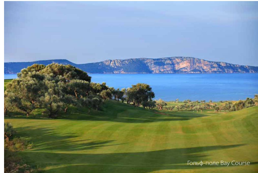
Гольф-поле Bay Course

Пески пляжа на юго-западном побережье The Dunes Beach будто пронизаны ласковым шепотом волн Ионического моря, ароматами виноградников, оливковых и апельсиновых рощ. Живописные города и колоритные деревушки, богатейшие термальные источники, прославившие регион еще в античные времена, недаром сегодня влекут сюда самых разборчивых искателей привилегированного отдыха. Первоклассные традиции местного гостеприимства возведены здесь в ранг высокого искусства.