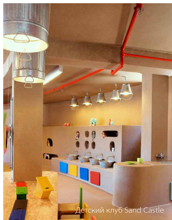
Детский клуб Sand Castle

Чтобы доставить прекрасным гостям курорта незабываемое удовольствие, огромный комплекс Anazoe Spa помимо многочисленных услуг предложит свои фирменные косметические процедуры. Уникальный компонент - экстракт оливкового дерева, обработанный особым способом (oleotherapy®). Рецепт тера-