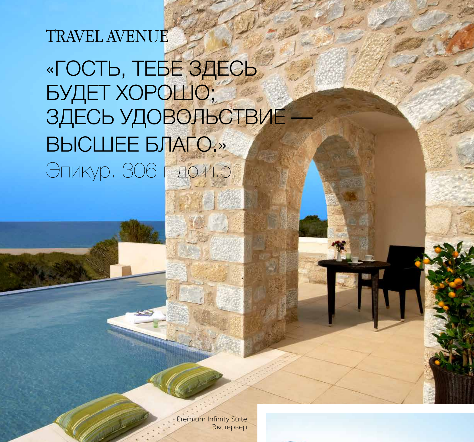
Premium Infinity Suite Экстерьер

П олуостров Пелопоннес – уникальный уголок греческой земли, по сей день оставшийся нетронутым, и потому неповторимый и безупречный. Это место, где жизнь течет в особенном ритме. Здесь каждое дуновение ветра воскрешает в памяти чудесные и будоражащие воображение легенды Древней Греции.