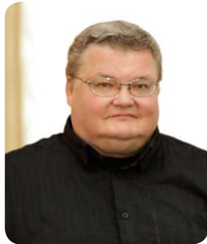
Сергей Стадлер, народный артист России, и.о. ректора Санкт-Петербургской консерватории.

1. Впервые я побывал в Финляндии в 80-м году. Я приехал в Хельсинки, чтобы принять участие в одном из самых престижных скрипичных конкурсов – конкурсе имени Яна Сибелиуса, который проводится раз в пять лет. Эта поездка оказалась для меня очень успешной – я стал лауреатом конкурса и получил специальный приз публики. Поэтому в Финляндии меня знают, и я с большим удовольствием приезжаю в эту замечательную страну с концертами.